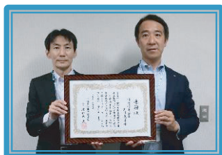
川崎信用金庫野川支店 [小]