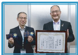
川崎信用金庫向ヶ丘支店 [創][改]