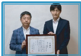
神奈川銀行川崎支店[改]