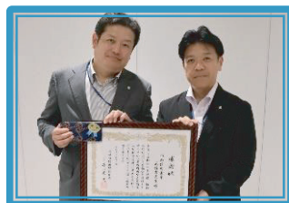
城南信用金庫元住吉支店 [連]