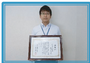
川崎信用金庫平間支店 [S]