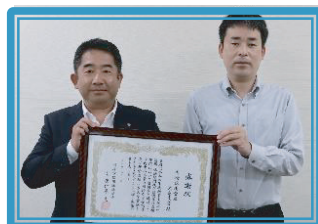
川崎信用金庫大島支店 [創][連][設]