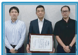
川崎信用金庫鹿島田支店 [改]