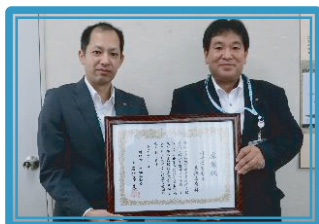
川崎信用金庫長沢支店 [承]