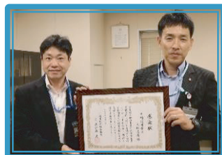
川崎信用金庫大師支店 [小]