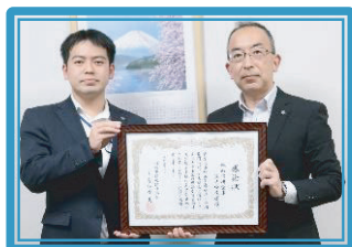
城南信用金庫溝ノ口支店 [連]