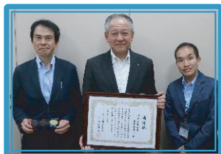
川崎信用金庫本店営業部 [小]