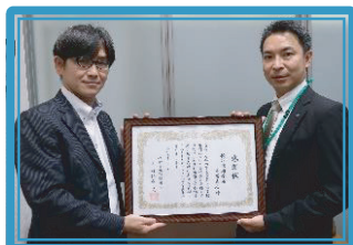
横浜信用金庫市場支店 [承]