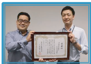
川崎信用金庫新城支店 [設]