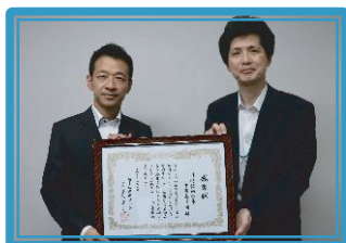
川崎信用金庫中野島支店 [S]