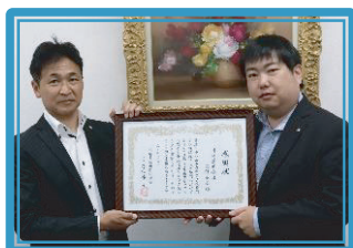
川崎信用金庫高津支店 [創][設]