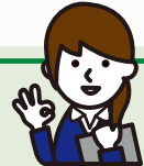
運搬業 50代 女性

このような制度があることを知り、ありがたく思っております。他の事業者の方にも広く知られ、利用されると喜ばれると思います。