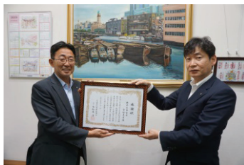
横浜信用金庫市場支店