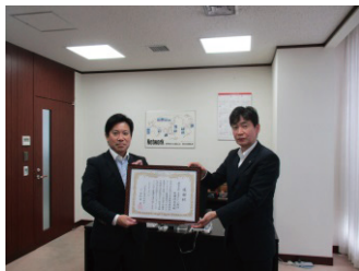
三菱UFJ銀行新横浜支店