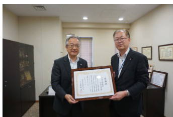
川崎信用金庫大師支店