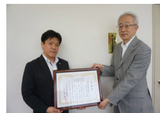
城南信用金庫元住吉支店