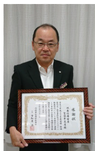
城南信用金庫宮前平支店