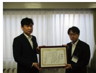
川崎信用金庫子母口支店