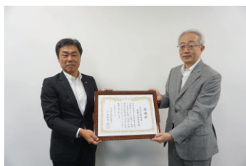
川崎信用金庫武蔵小杉支店