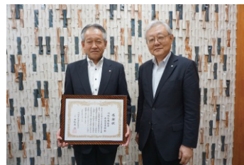
川崎信用金庫本店営業部