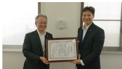
川崎信用金庫向ヶ丘支店