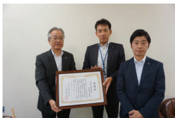
川崎信用金庫大島支店