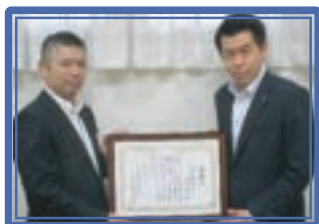
城南信用金庫鷺沼支店[連]