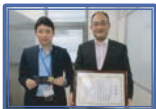
川崎信用金庫向ヶ丘支店 [小]