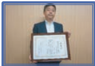
神奈川銀行川崎支店[連]