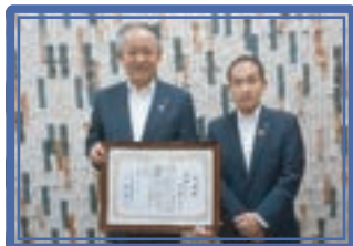
川崎信用金庫本店営業部 [小] [設]