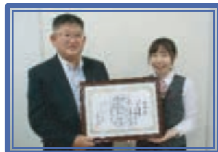
川崎信用金庫高津支店[改] [設] [S]