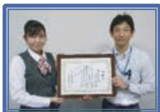
川崎信用金庫百合丘支店 [承]