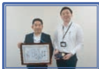
川崎信用金庫大島支店[小]