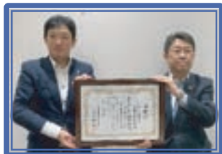
川崎信用金庫武蔵小杉支店 [創]