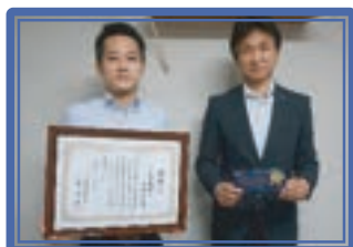
川崎信用金庫小田支店[創]