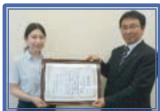
川崎信用金庫御幸支店[改]