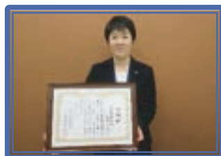
城南信用金庫生田支店[承]