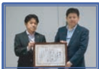
城南信用金庫元住吉支店 [連]