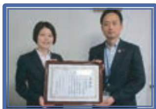
川崎信用金庫子母口支店 [承]