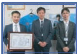
川崎信用金庫中野島支店[S]