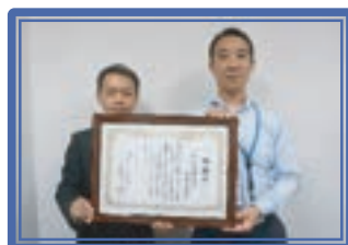
川崎信用金庫宮内支店[S]