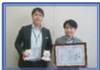
芝信用金庫新城支店[承]