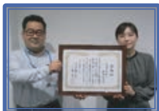
川崎信用金庫新城支店[創] [設]